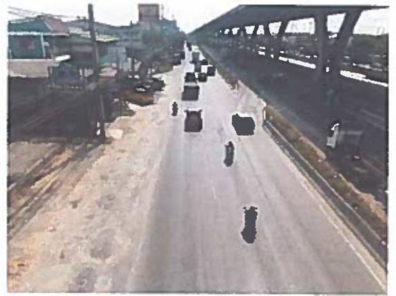
(พื้นที่ดำเนินการกิจกรรม)

ประธาน ในส่วนของโครงการเดิมที่ที่กำหนดไว้ใน Y๒ นั้น จะมีการติดตั้งท่อระบายน้ำและทางเดินเท้าด้วย แต่เมื่อขอโอนเปลี่ยนแปลงแล้วสามารถทำได้แค่บูรณะทางผิวแอสฟัลท์ในทางหลวงหมายเลข ๓๔ ๖ ถ้าหากดำเนินการเสร็จเรียบร้อยแล้วจะเกิดปัญหาอะไรในอนาคตหรือไม่ ถ้าจะสร้างท่อระบายน้ำ หรือทางเดินเท้าที่หลัง จะเกิดผลกระทบต่อพื้นผิวถนนหรือไม่