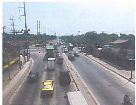
(พื้นที่ดำเนินการกิจกรรม)